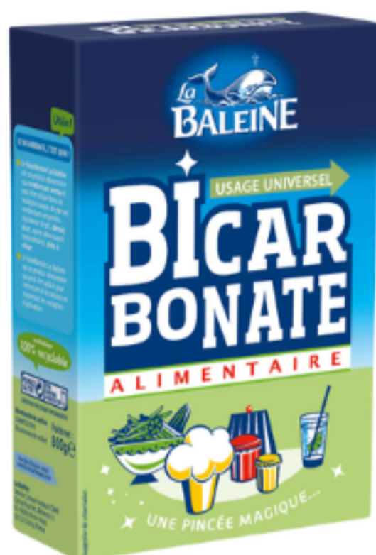
bicarbonate de soude